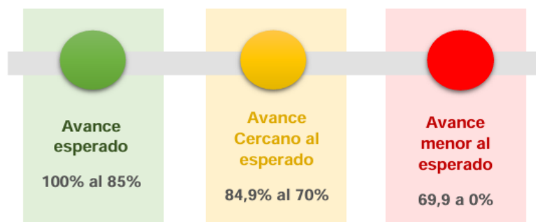
Ilustración 3 Categorización ejecución física y presupuestaria

Elaborado por: Secretaría Nacional de Planificación -Subsecretaría de Seguimiento, 2025