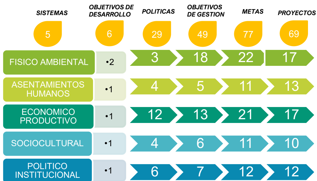
Figura 1. Plan de Desarrollo y Ordenamiento Territorial de la provincia por sistemas.