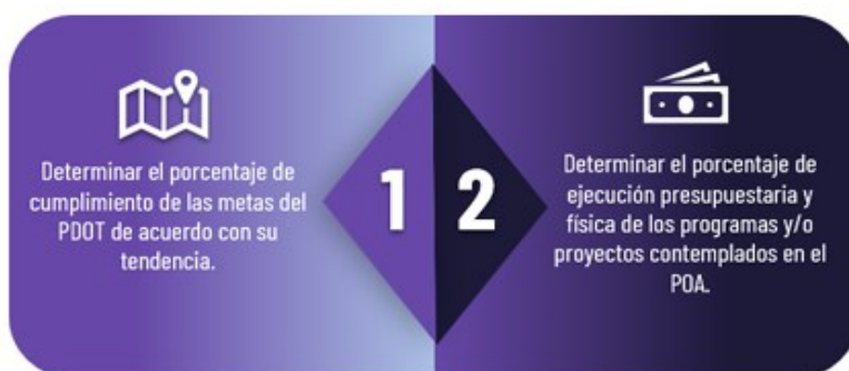
Ilustración 1 Fase de Seguimiento

Elaborado por: Secretaría Nacional de Planificación -Subsecretaría de seguimiento, 2025