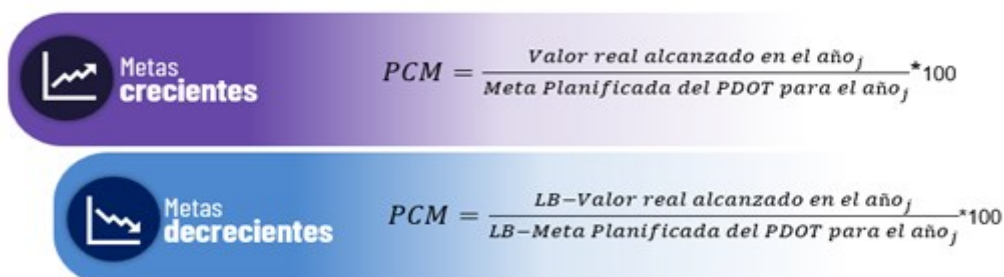
Ecuación 1 Fórmula de cálculo - Porcentaje de Cumplimiento de Metas

PMC: Porcentaje de Cumplimiento de la Meta LB: Línea Base j: año de análisis Elaborado por: Secretaría Nacional de Planificación -Subsecretaría de seguimiento, 2025