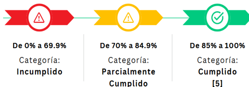
Figura 3. Rangos de cumplimiento de avance presupuestario de los proyectos.

Nota: Secretaría Técnica Planifica Ecuador, 2024.