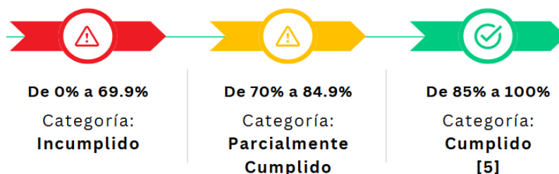
Figura 2. Rangos de Cumplimiento de Avance Físico o de Cobertura de Proyectos

Nota: Secretaría Técnica Planifica Ecuador, 2024.