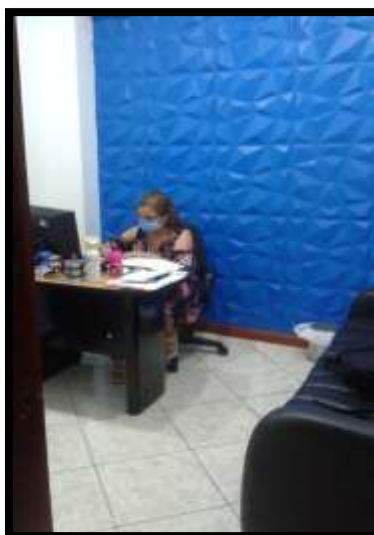
Fotografía 17. Área administrativa.

Se realiza en las oficinas ubicadas en la planta baja, abarca las actividades relacionadas con la administración del talento humano y los recursos para el funcionamiento de la clínica.