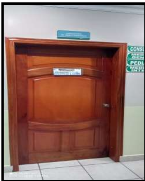
Fotografía 13. Consultorios