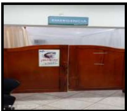
Fotografía 2. Sala de emergencia. Camillas fijas y móviles.

En esta área se ofrece atención a pacientes que requieren cuidados emergentes debido a su estado de salud. Cuenta con camillas para transportar pacientes, insumos médicos para curación, instrumental médico. También cuenta con una Unidad de choques.