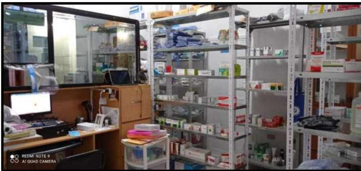
Fotografía 14. Farmacia

La clínica está equipada con una farmacia funcional abastecida de implementos y medicamentos necesarios para primeros auxilios.