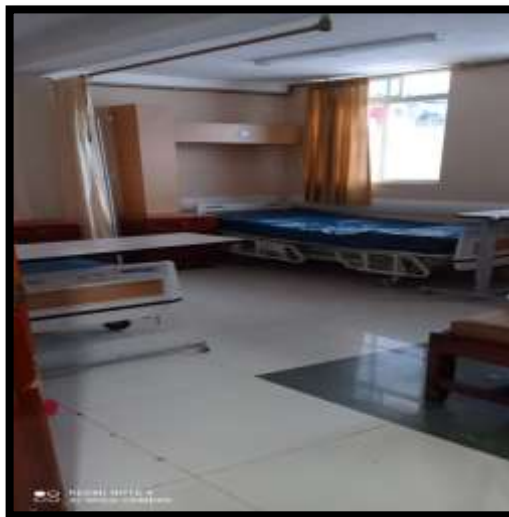
HABITACIONES SENCILLAS Y DOBLES