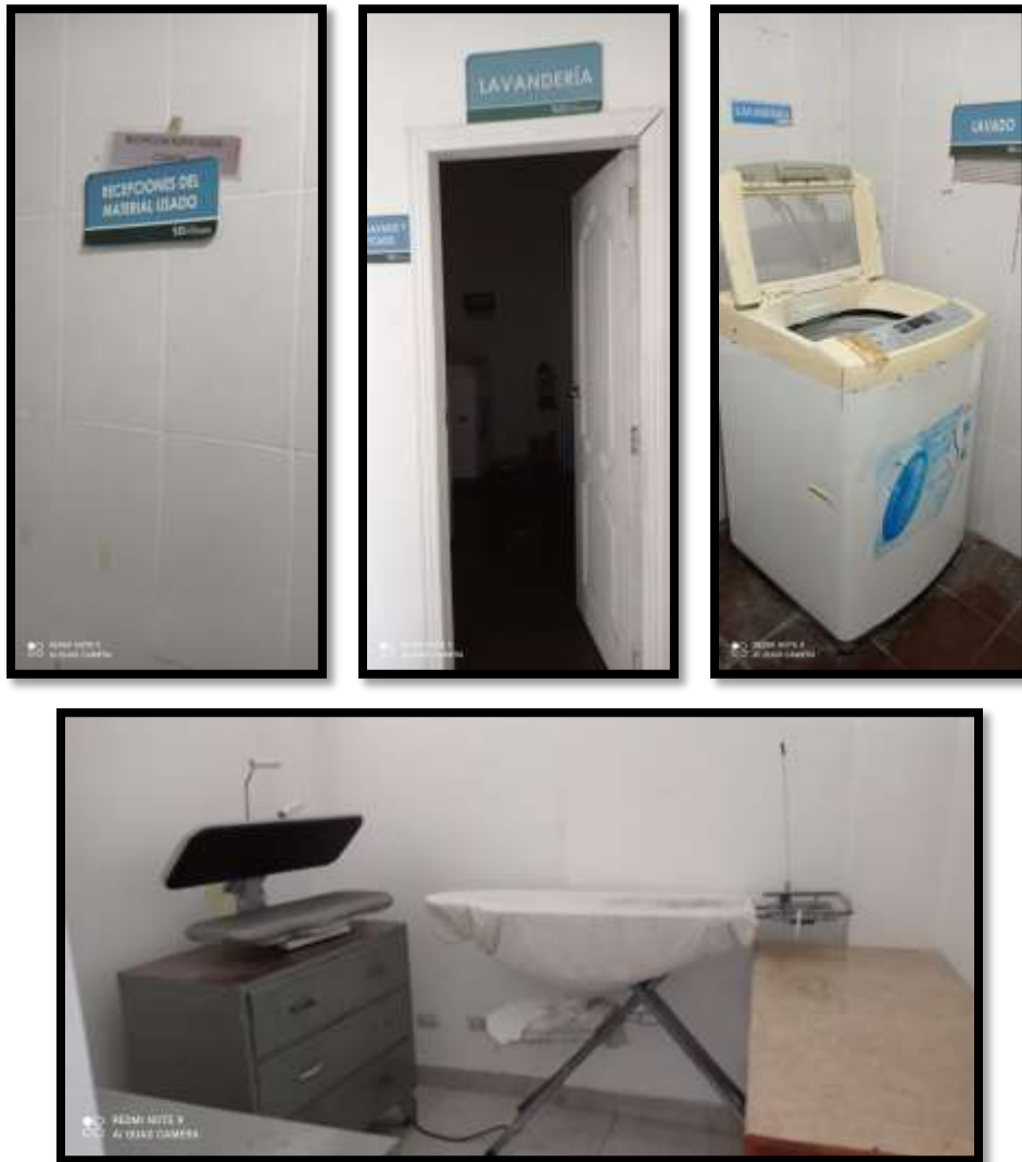
Fotografías 13. Área de mantenimiento y lavandería.