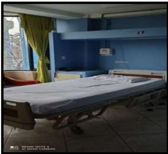
Fotografía 1. Área de hospitalización

La clínica cuenta con 5 habitaciones 3 habitaciones simples y 2 habitaciones dobles dotados de mobiliario (cama, silla) servicios higiénicos.