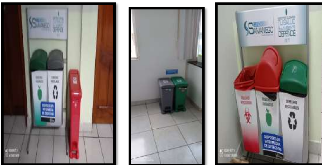
Fotografía 16. Área de almacenamiento temporal de desechos comunes