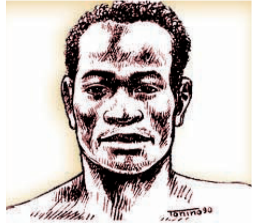
ALONSO DE ILLESCAS Héroe Negro Ecuatoriano - Siglo XVI