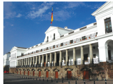
Palacio de Carondelet, casa de Gobierno símbolo del poder político del Ecuador