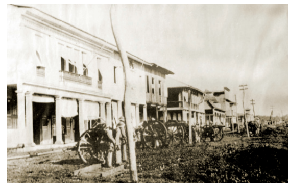
Malecón de Esmeraldas durante la Guerra de Concha

La Ley de División Territorial dictada por la Convencional Nacional de 1861, que mandó ejecutar don Gabriel García Moreno el 29 de Mayo del mismo año, ya establece a Esmeraldas como provincia en igualdad de condiciones de las restantes de la Patria.