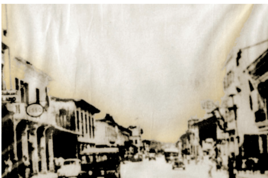
Panorámica de Esmeraldas en 1970