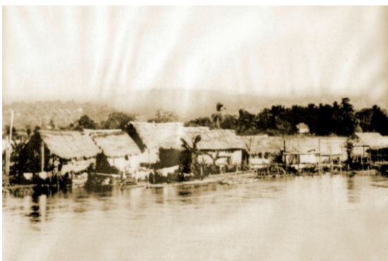
Barrio Isla Piedad en sus orígenes