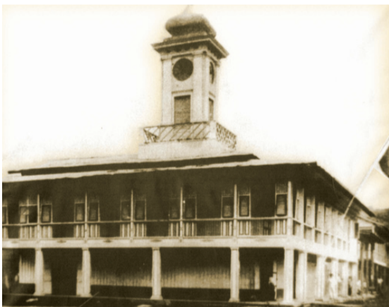
Palacio Municipal 1915