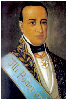
Vicente Ramón Roca Rodríguez Presidente del Ecuador desde el 8 de diciembre de 1845 hasta el 15 de octubre de 1849.

Sin embargo, el Congreso de ese año, hizo extensiva a Esmeraldas, por decreto del 18 de noviembre de 1847, y sancionado por el entonces Presidente de la República Vicente Ramón Roca, el 20 de noviembre de 1847, la Ley del 17 de noviembre de 1846 que daba a las provincias de Quijos, Canelos, Macas, Gualaquiza y el Rosario, un trato y organización especial por su condición de atraso y la distancia de los centros políticos. El decreto aparece publicado en el periódico "El Nacional", registro oficial de la época, con fecha 23 de noviembre de 1847, año 2 trimestre octavo, número 126. De esta manera Esmeraldas llegó a constituirse como provincia de un modo distinto a la generalidad de las demás provincias.