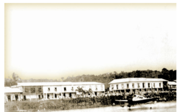
Río Esmeraldas con el acuatillaje del 1er hidroavion de Esmeraldas